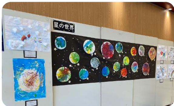
ベイドリーム清水