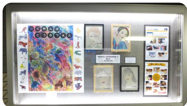
地下道ギャラリー