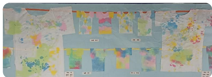
アピタ静岡空中通路